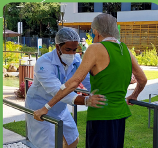
Pós Fratura de Quadril